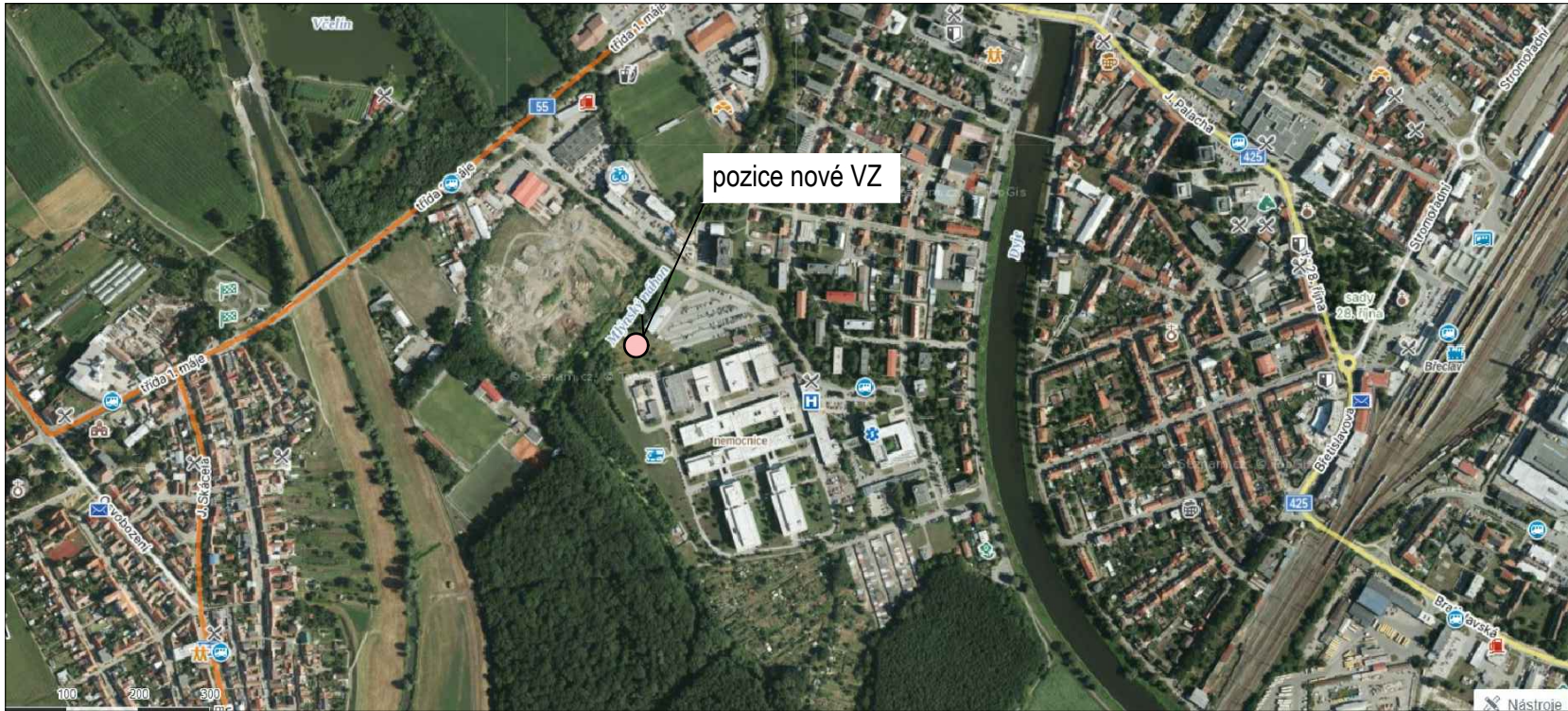
Ortofoto M 1:10 000